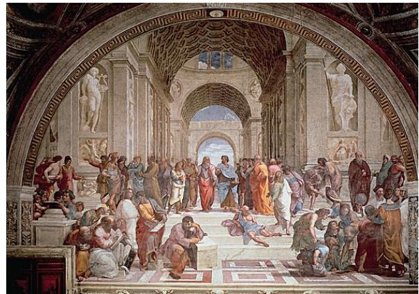
L'école d'Athènes – Raphael