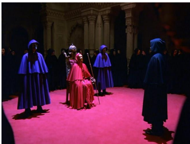
Eyes Wide Shut - Kubrick