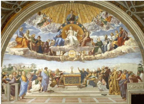
Dispute du Saint-Sacrement - Raphael