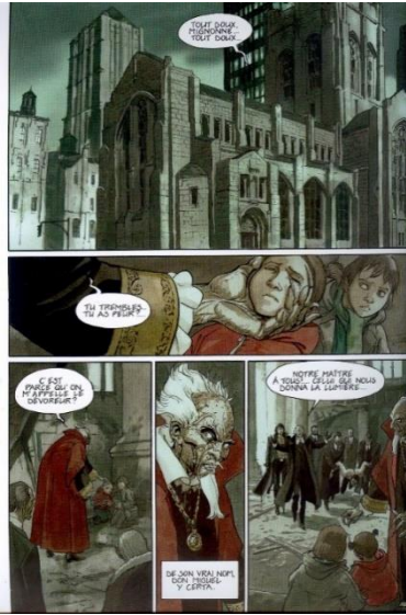
Rapace — Enrico Marini