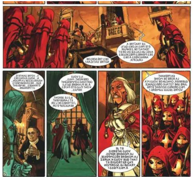
Scorpion — Enrico Marini,