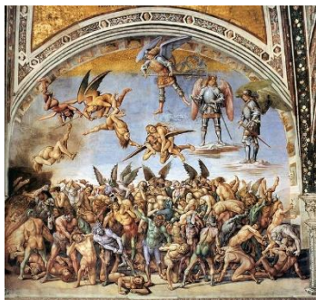
Les damnées – Lucas Signorelli